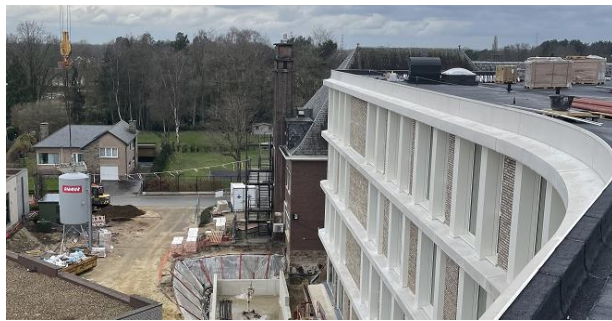
Een moderne architectuur met veel aandacht naar lichtinval en contact met de omgeving