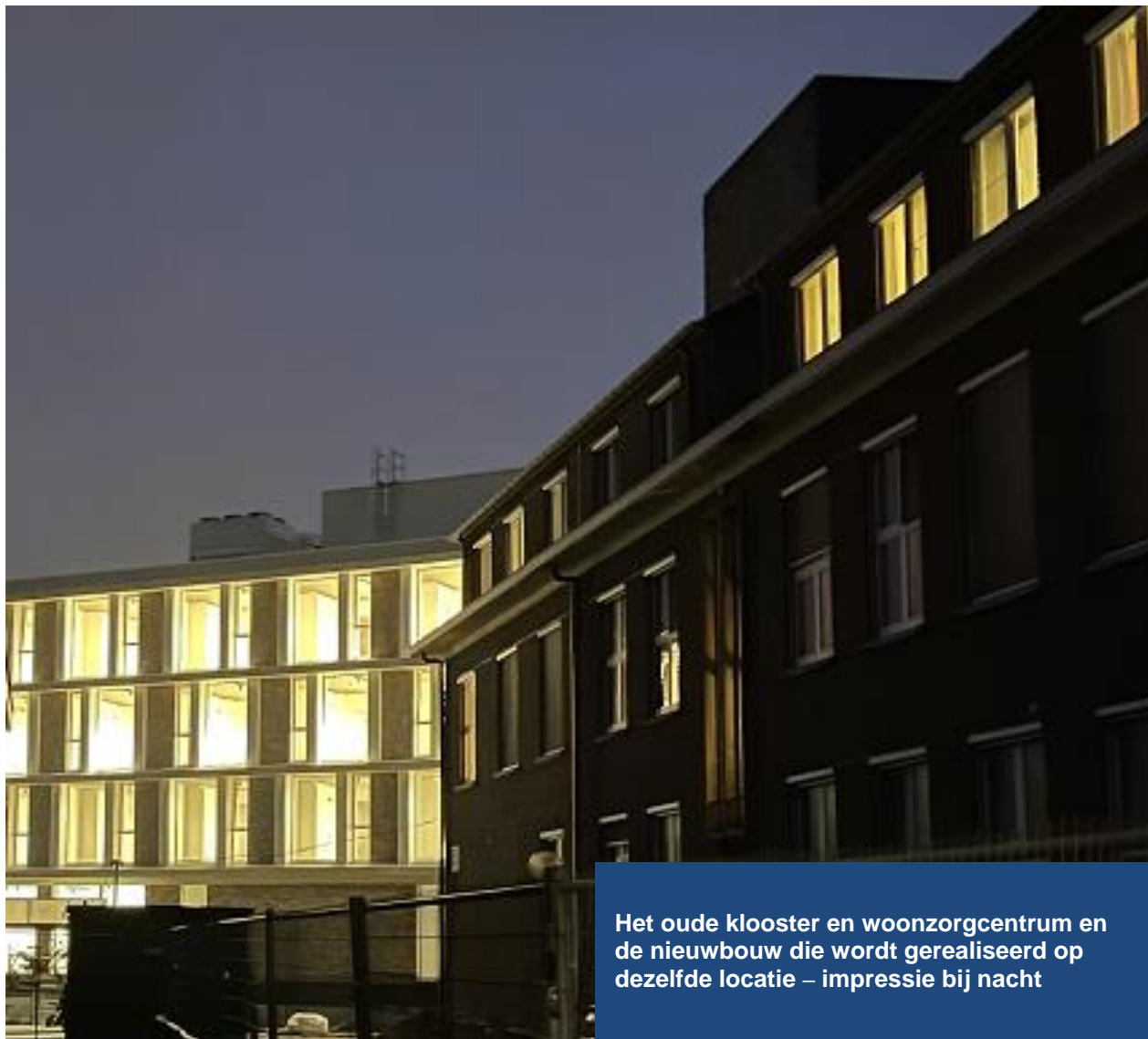
Het oude klooster en woonzorgcentrum en de nieuwbouw die wordt gerealiseerd op dezelfde locatie – impressie bij nacht