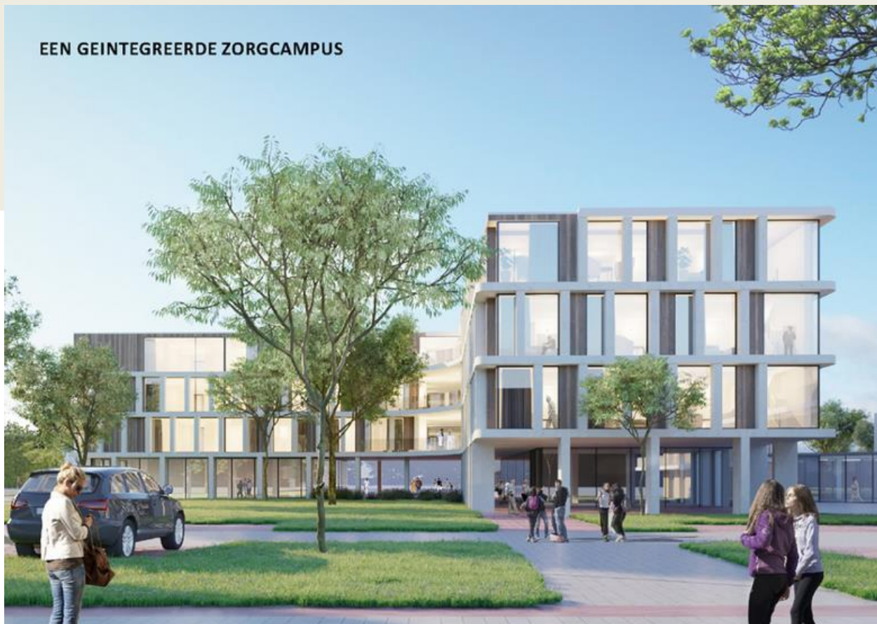
EEN GEINTEGREERDE ZORGCAMPUS

Op campus H. Catharina kom je terecht in een organisatie waar in elk dorp collega's de nodige opleiding hebben gekregen om je te begeleiden in je nieuw avontuur.