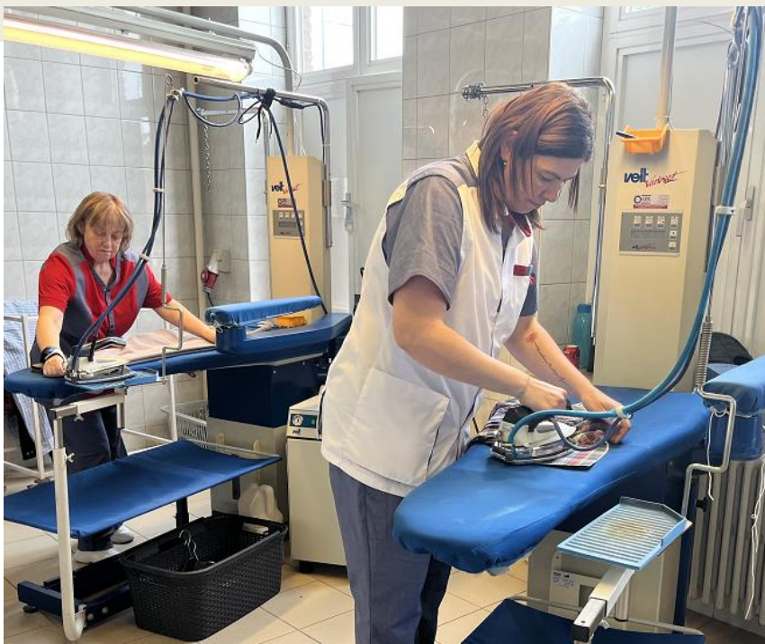
Op het logistieke niveau is een professionele wasserij voorzien voor de was en de strijk van de persoonlijke was van de bewoners

middag werk je de vers voorbereide maaltijden af en dien je deze op. Je leert de bewoners op een andere manier kennen. Tegelijkertijd zorgt deze job voor een mooie afwisseling aangezien je ook in de zorg staat. Bij elke stap word je begeleid zodat je gemakkelijk je eigen manier van werken kan vinden en ten volle als gastheer of gastvrouw de bewoner een tof maaltijdmoment kan bezorgen.