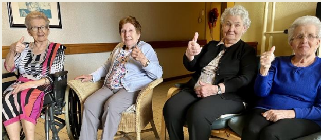
De bewoners ontvangen je met open armen